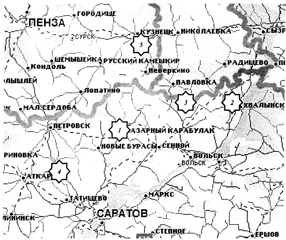
Рис. 1. Районы произрастания исследованных популяций Antennaria dioica : 1 – Базарно-Карабулакский; 2 – Хвалынский; 3 – Вольский; 4 – Татищевский (Саратовская обл.); 5 – Кузнецкий (Пензенская обл.)