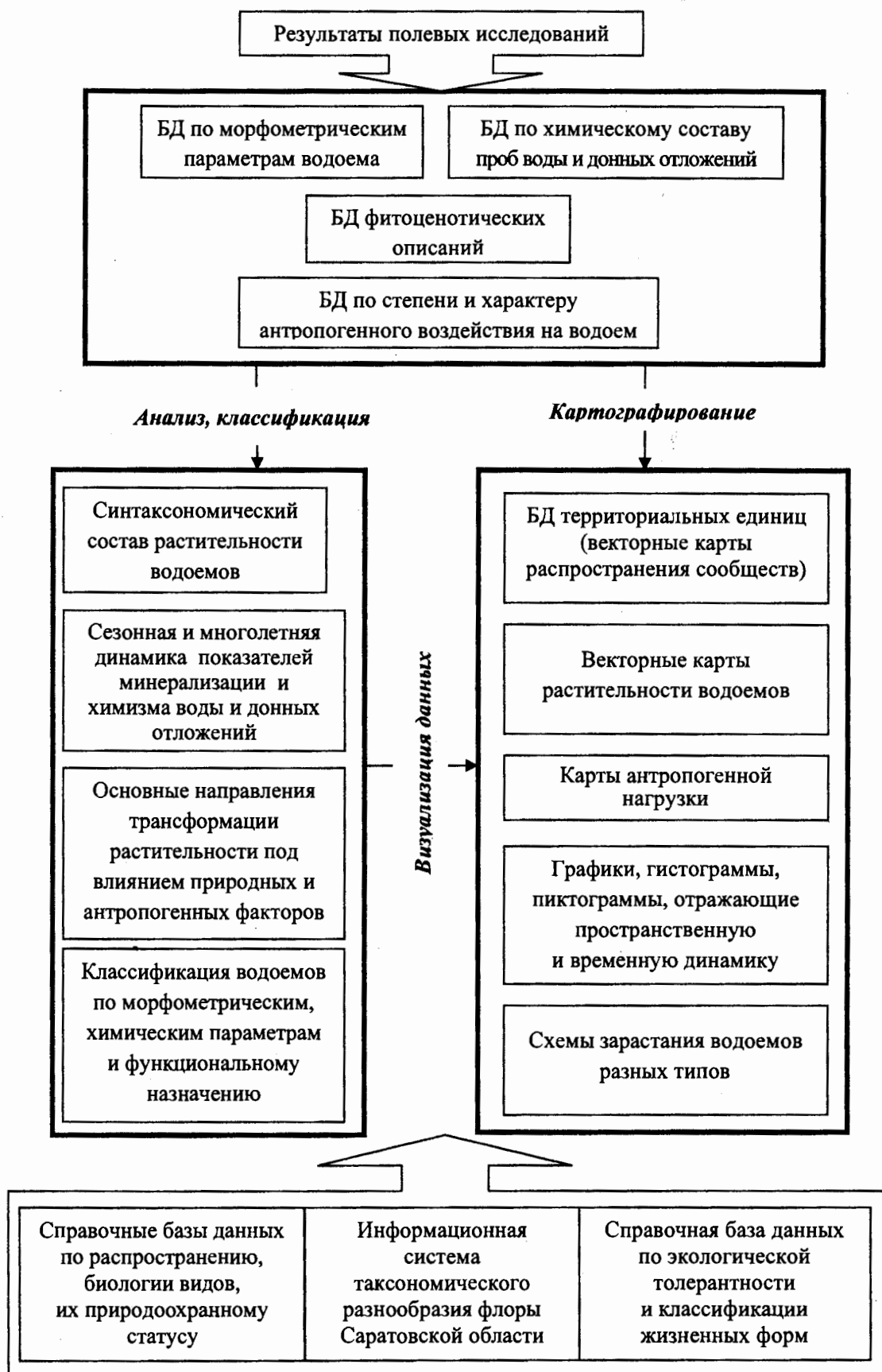
Рис. 1. Организация аналитической ГИС «Состояние растительности водоемов саратовского Заволжья»