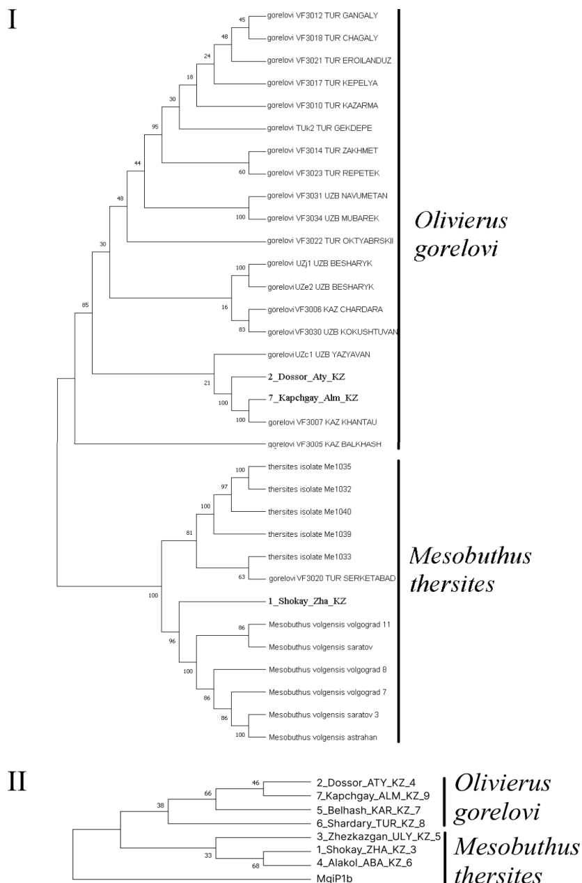
Рис. 2. Дендрограммы, построенные на основе анализа расшифрованных нуклеотидных последовательностей фрагментов генов: COI (I), дефенсина, протеинкиназы и тиоредоксина (II) скорпионов, обитающих в Нижнем Поволжье (Саратовская, Волгоградская, Астраханская области), а также Туркменистана, Узбекистана, Казахстана

введены последовательности, полученные в ходе работы авторов по определению видового статуса популяций скорпионов из Нижнего Поволжья (Саратовская, Волгоградская, Астраханская области) [2]. Полученные результаты по разным генам представлены на кладограммах I и II (рис. 2).