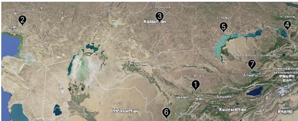
Рис. 1. Места сбора скорпионов, обитающих на территории Казахстана. Чёрными точками отмечены места сборов: 1 – село Шокай (Жамбылская область), 2 – посёлок Доссор (Атырауская область), 3 – окрестности города Саптаев (Карагандинская область), 4 – озёра Алаколь (Абайская область), 5 – Балхаш (Карагандинская область), 6 – берег Шардаринского водохранилища (Туркестанская область), 7 – окрестности города Капчагай (ныне Конаев) (Алматинская область) [5]