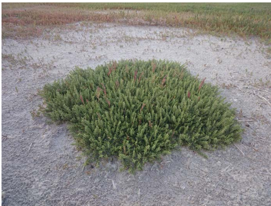
Сарсазан шишковатый в долине р. Камышлак

Крупная популяция сарсазана шишковатого описана нами в долине реки Камышлак в неглубокой балке, открывающейся к озеру Бол. Морец (рисунок). В почвенном покрове отмечены солончаки гидроморфные, солонцы мелкие, а также смытые и намывные засоленные почвы.