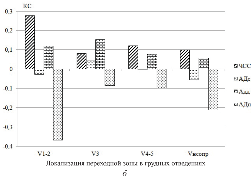
Коэффициент сдвига реакций сердечно-сосудистой системы на фоне активной ортостатической пробы в группах студентов: а – российских; б – иностранных

в сочетании с повышением диастолического давления, что, в свою очередь, приводило к резкому снижению пульсового давления, особенно в группах с локализацией переходной зоны в V_{1-2} и V_{неопр} , и указывало на напряжение регуляторных систем и нестабильность процессов деятельности сердечно-сосудистой системы.