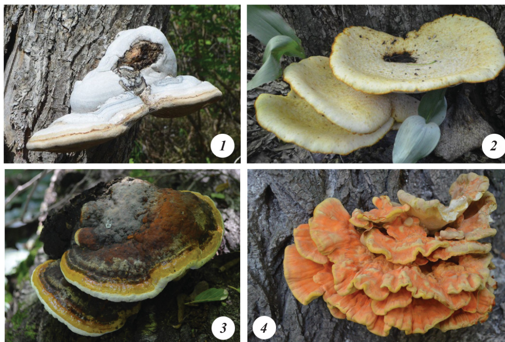
Рис. 1. Плодовые тела исследованных видов ксилотрофных грибов: 1 – Fomes fomentarius , 2 – Polyporus squamosus , 3 – Fomitopsis pinicola , 4 – Laetiporus sulphureus

Надо отметить, что в сборах практически не представлены Staphylinidae, такие как Gyrophana , Atheta и др., отсутствуют виды семейства Ciidae, характерные для трутовиков. Вероятно, стоит изменить методику сбора на применение флотации и разнотипных эклекторов и ловушек [29], а также провести сбор материала в разные сроки с учетом состояния плодовых тел самих ксилотрофных грибов, так как известно,