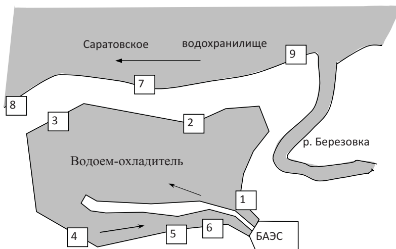
Рис. 1. Схема расположения площадок на акватории водоема-охладителя БАЭС (№ 1–6), на Саратовском водохранилище (№ 7–9)

Изучение флоры и растительности осуществлялось путем детально-маршрутного исследования с подробным описанием водных и прибрежно-водных фитоценозов, руководствуясь общепринятой методикой геоботанических исследований водной растительности [4, 5]. Учетные площадки располагались в тепловодной зоне (отводящий канал) водоема-охладителя (№№ 1–3), в холодноводной зоне (приводящий канал) БАЭС (№№ 4–6), на мелководьях Саратовского водохранилища вблизи дамбы водоема-охладителя (№ № 7–9) (рис. 1).